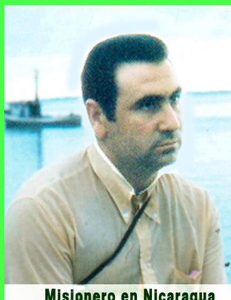
Misionero en Nicaragua